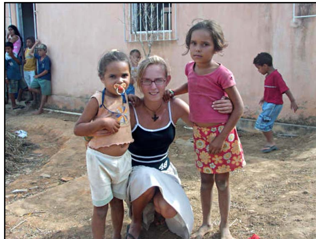
St.-Gabriël en SOS willen nieuw leven voor de bloemenkinderen!

E en ontwikkelingsproject kan wel eens vastlopen. Zo financierde SOS een "bloemenschooltje" in Palmares. Door allerlei omstandigheden zijn de lessen gestopt. Wij willen samen met St.-Gabriël dit project nieuw leven inblazen door de onkosten voor de lessen artisanat samen te bekostigen.