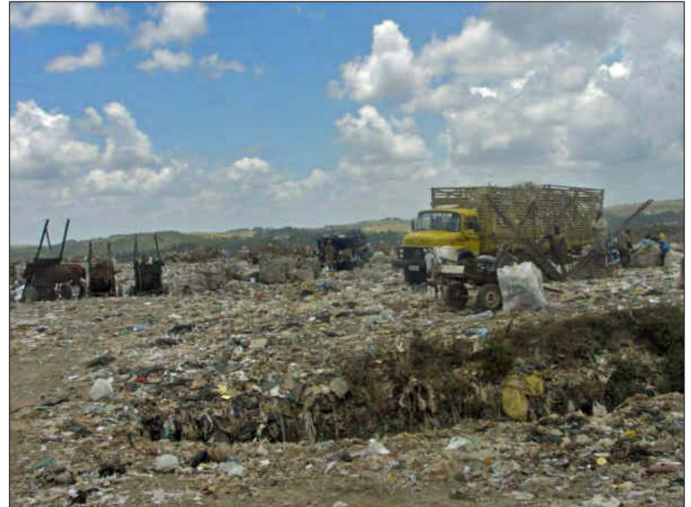
De vuilnisbelt van Muribeca.

Door de groei van het project is er behoefte aan meer en/of andere persmachines en werkkledij. SOS onderzoekt dit dossier.