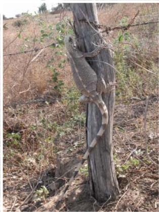
Foto links : Bij een wandeling door de landbouvvelden stoten wij op een leguaan.