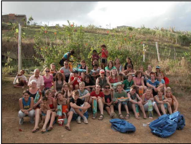
Leerlingen en leerkrachten van het St.-Gabriëlcollege van Boechout bezoeken Palmares.

E en ontwikkelingsproject kan wel eens vastlopen. Zo financierde SOS een "bloemenschooltje" in Palmares. Door allerlei omstandigheden zijn de lessen gestopt. Wij willen samen met St.-Gabriël dit project nieuw leven inblazen door de onkosten voor de lessen artisanat samen te bekostigen.